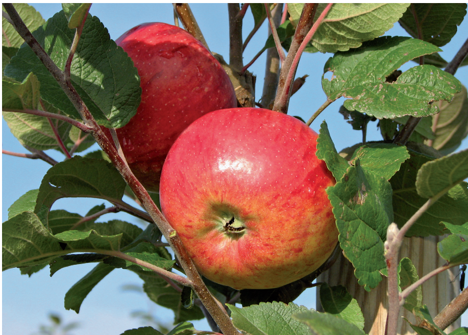
Eine alte Sorte mit niedrigem allergenem Potenzial ist der 'Altländer Pfannkuchenapfel'

standen bei einem der Gene Alleldosiseffekte in engem Zusammenhang mit dem Grad der Allergenität.