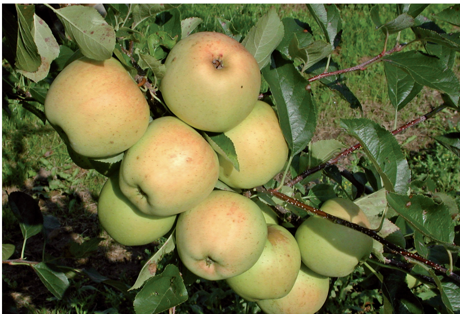
'Golden Delicious' gehört zu den Sorten mit hohem allergenem Potenzial.

Mal d 4 ist in vielen Früchten enthalten. Allen untersuchten allergischen Reaktionen gegenüber diesem Proteintyp in Früchten