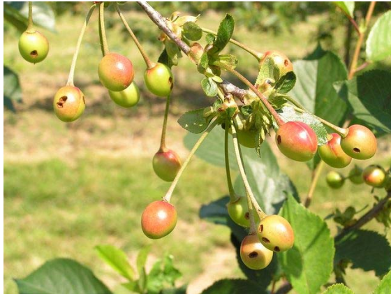
Bild 1: Fruchtschaden durch Purpurroten Fruchtstecher an Sauerkirsche

Bisher waren fruchtschädigende Käfer wie der purpurrote Apfelfruchtstecher ( Rhynchites bacchus ) und der Kirschkernstecher ( Anthonomus rectirostris ) nur lokal in rheinhessischen Sauerkirschanlagen zu finden. In den letzten Jahren konnten diese Käfer-Arten aber vermehrt festgestellt werden. Aufgrund der Fruchtschädigung kann